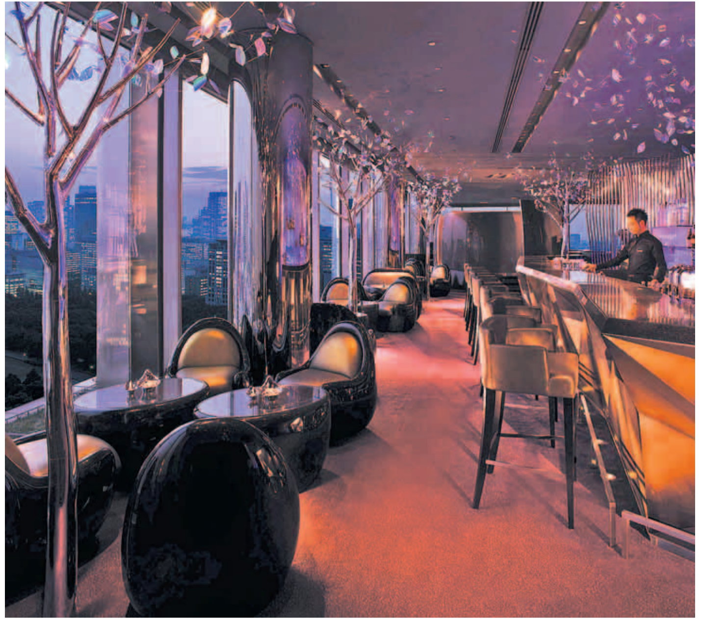
Das „Peter“ im „Peninsula“ zählt zu den spektakulärsten Hotelrestaurants in Tokio (gr. Foto). Das „Park Hyatt Tokyo“ residiert in den obersten 12 Etagen einer 52-stöckigen Wolkenkratzerformation (l. o.). Im „Ryokan Homeikan“ wird nur japanisches Frühstück serviert. Höhepunkt: Algen-suppe (l. u.)

„TOKIO IST JA SCHON irgendwie der Wahnsinn, obwohl wir alle noch nie da waren.“ Das sagt kein Geringerer als Bill Kaulitz, Sänger von Tokio Hotel – der mit der Manga-Frisur. Der Mann hat recht. Denn die japanische Hauptstadt ist verwirrend (ein Irrgarten aus Straßen, Schienen und Schriftzeichen), bunt (leuchtende Neonbildschirme überall), groß (zwölf Millionen Einwohner), kreativ (aus Platzmangel spielt man Golf auf Hausdächern) und gegensätzlich (hier die Mutter im Kimono, dort ihre Gothic-Lolita-Tochter). Der Wahnsinn eben.